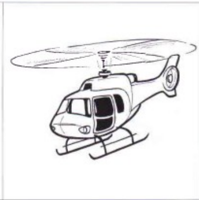
éponge - école - hélicoptère