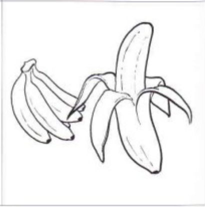
balaie - balançoire - bananes