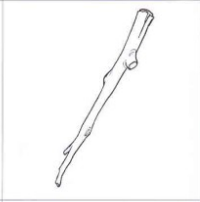
éventail - bateau - bâton