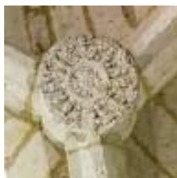
La tête de lion, un élément du tétramorphe ou les quatre vivants représentant St Marc.