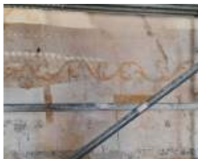
Frise découverte lors des travaux datant du 19 e siècle.

Les travaux de l'Église de Mourrens se poursuivent. Les sculptures des chapiteaux sont en cours de restauration. Le badigeon sur les murs est désormais terminé.