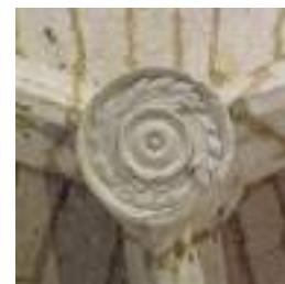
Représente des feuilles d'acanthé.

Retrouvez la liste complète des Associations de Sainte-Colombe-en-Bruilhois sur notre site internet :