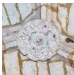
Représente des fleurs.