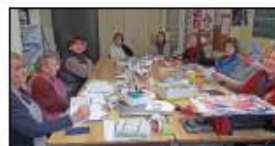
Reprise de la lecture le 4 oct. 2022