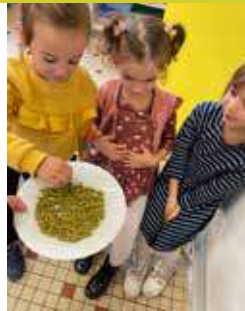
Chez les MG et GS

“Pour la semaine du goût, nous avons goûté des aliments amers, acides, sucrés et salés. Chaque jour il y avait une couleur différente, c'était délicieux !”