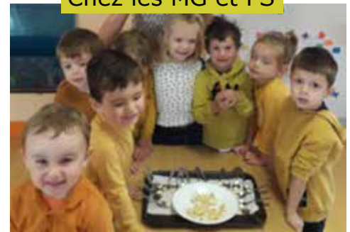
Chez les MG et PS

“Nous avons beaucoup aimé la banane et nous avons moins aimé l'endive qui était amère !”