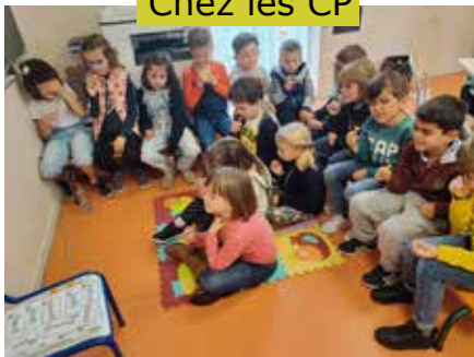
Chez les CP

“Durant la semaine du goût, on a aimé fermer les yeux et deviner les aliments !”